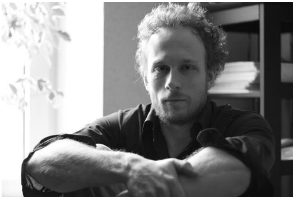
Christophe Ghislain